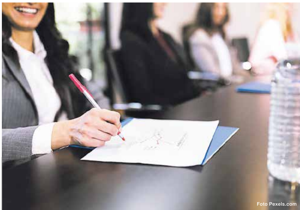
Como parte de los ejes temáticos del congreso se abordarán: herramientas tecnológicas en la docencia, investigación en el área educativa, habilidades para la vida, desarrollo de competencias, metacognición en procesos de aprendizaje.

Según la descripción divulgada por la Escuela de Secretariado Profesional, el objetivo del evento es “contribuir con la sociedad nacional e internacional, por medio de la creación de espacios reflexivos, de intercambio de experiencias cuyos temas