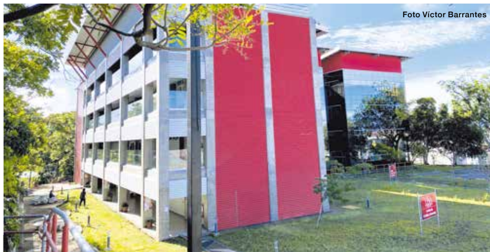
Desde la planificación institucional se plasma la consigna de la UNA por implementar prácticas ambientales sustentables (meta 4.4.1 del Plan de Mediano Plazo Institucional 2017-2021, prorrogado al 2022).

Además, se incluyen otras emisiones indirectas por consumo de GLP en sodas