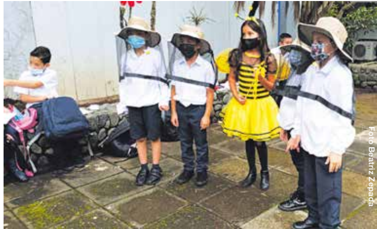
Los estudiantes de la Escuela Cleto González Víquez participaron en las actividades lúdico-educativas sobre las abejas y su importancia realizadas en la Biblioteca Infantil Miriam Álvarez Brenes.