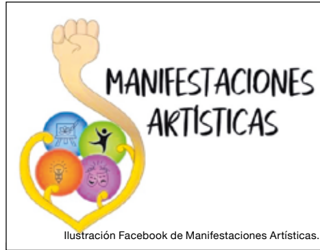
Ilustración Facebook de Manifestaciones Artísticas.