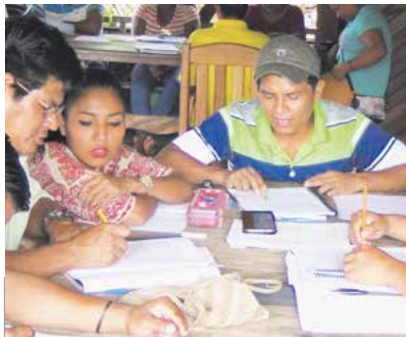
Durante diversos talleres, docentes de lengua y cultura crearon actividades didácticas para cada una de las 31 narraciones incluidas en el Libro de historias bribris, que también está disponible en formato PDF.